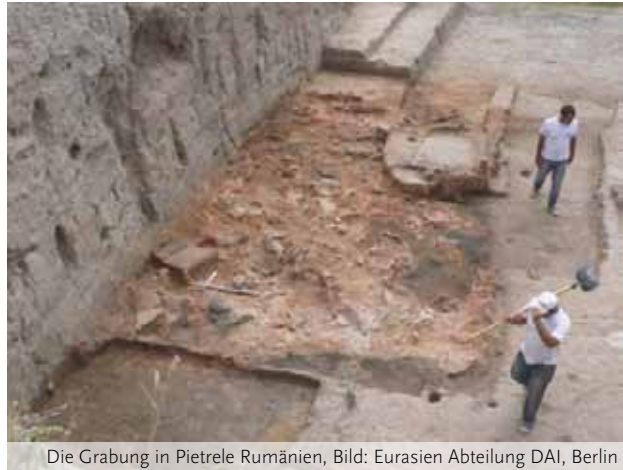
Die Grabung in Pietrele Rumänien, Bild: Eurasien Abteilung DAI, Berlin

Sommerzeit ist Grabungszeit. Und da ziehen die Archäologen gern aufs Feld, bewaffnet mit Spaten und sonstigem schwerem Gerät. Manchmal auch mit Pinsel und Lupe, aber das ist bekanntlich eher selten der Fall. Es muss zudem nicht unbedingt der Süden sein. Auch der Osten hat seine Reize und durch Untersuchungen der vergangenen Jahre wird immer deutlicher, dass hier wesentliche Innovationen stattfanden, welche die Welt nachhaltig beeinflusst haben.